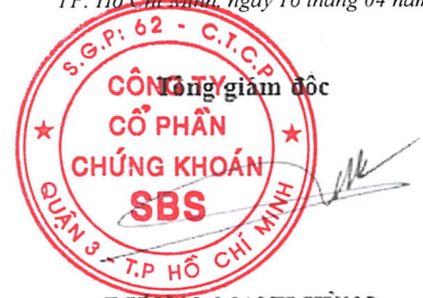
DƯƠNG MẠNH HÙNG